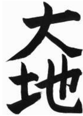
daichi : terre