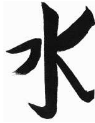
mizu : eau